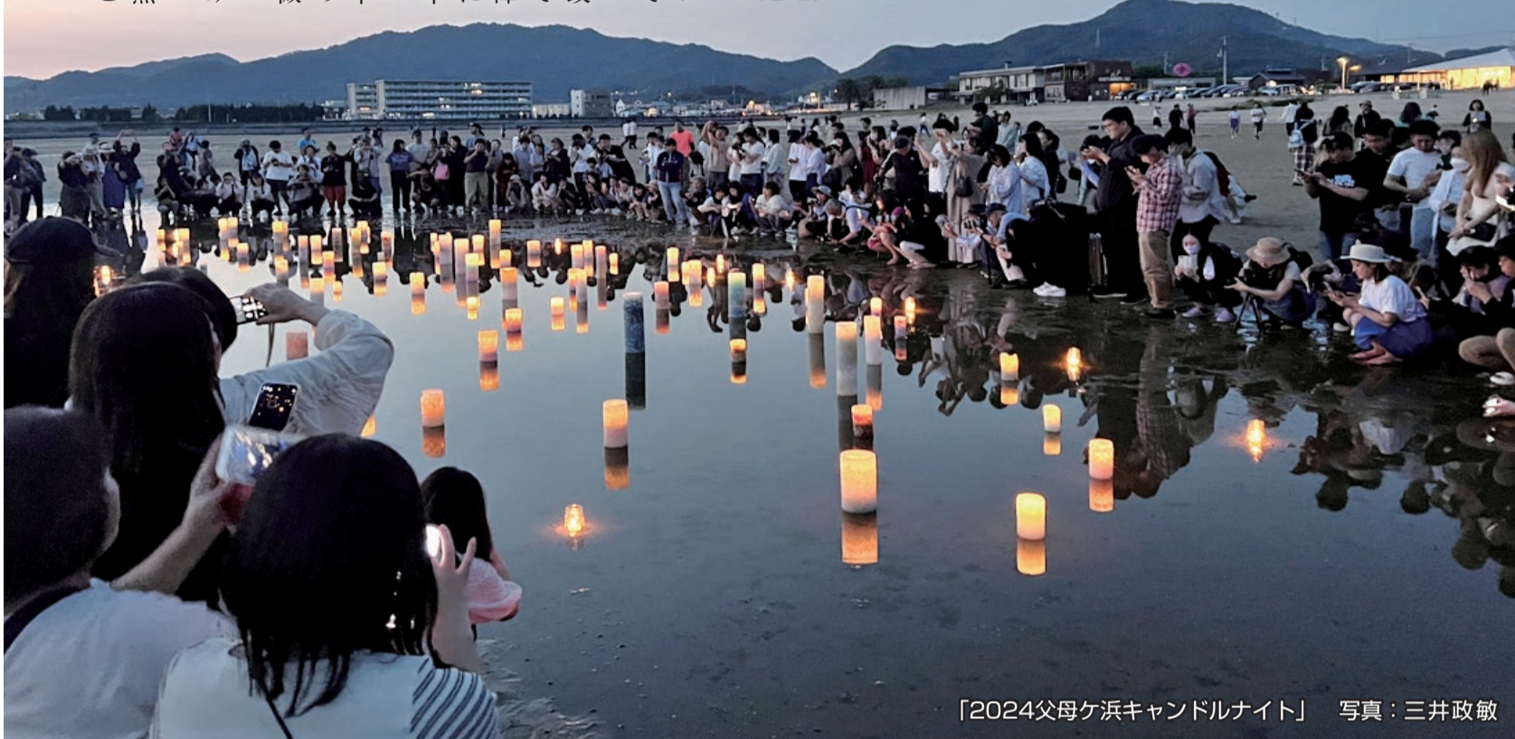
「2024父母ヶ浜キャンドルナイト」