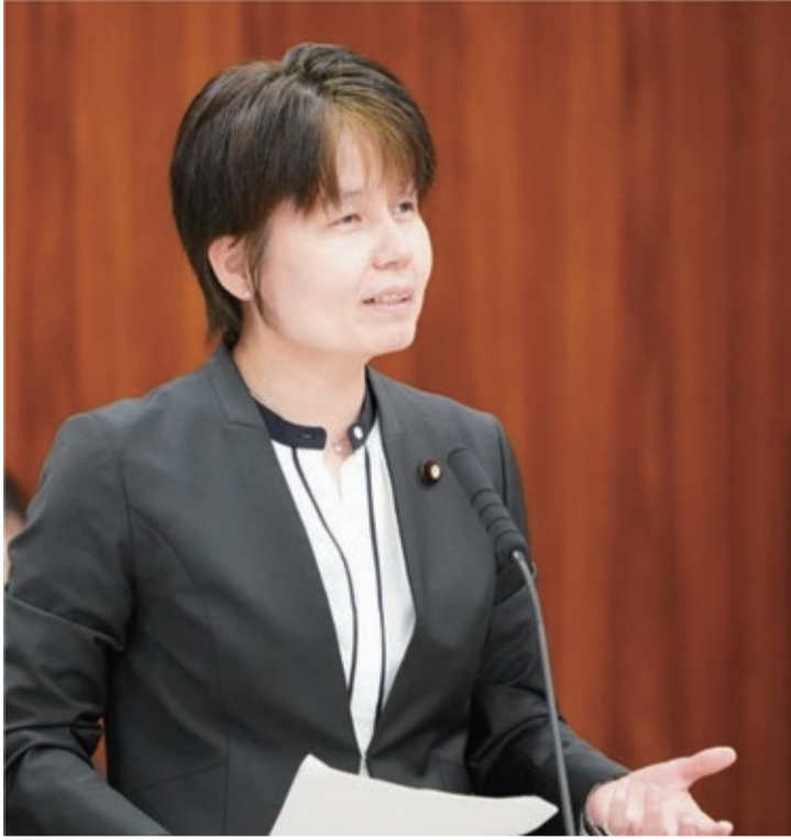
2024年5月 参議院総務委員会で税に関する問題を指摘

1999年4月に入社、2006年7月にNTT西日本を退職し、2007年7月の第21回参議院議員選挙で最年少当選者として議席をいただき、一貫して働く人の声や思いを届ける立場で国会活動を続けています。