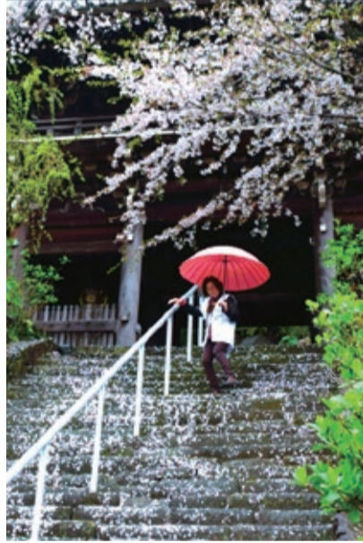
「気をつけて」 高松市 石川正治