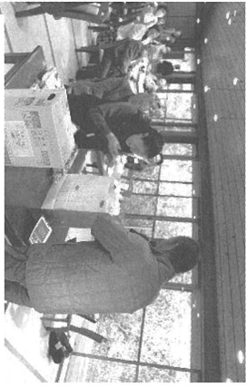
ビンゴゲームで楽しんで、西讃地区協総会

トツアを切った東讃地区協は、11月15日に大川オアシスで役員、手配り者など16人が参加しました。森会長は、高齢化が進んでおり、恒例のピエガーデンを昼食懇親会に切り替えたいと挨拶。総会後には食事会と久しぶりのビンゴゲームで交流を深めました。