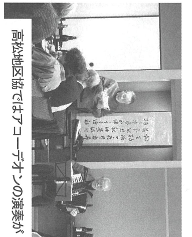
高松地区協ではアコギ演奏の演奏が