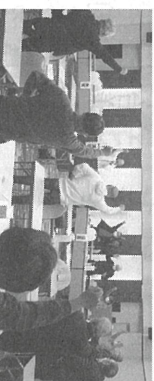
高松地区総会の模様