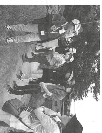
西讃バスツアーでガイドの説明を受ける

の古代史ロマンを感じさせられました。 朝食と買い物を含んで、倉敷美観地区へ。屋からの目玉であった川舟流しは、予約が効かず満席で中止となりました。自由散策の後、早目に帰路につきました。 今回のバスツアーは目的地も近く、シニアの旅行として楽しめた一日でした。 (今井 正・記)