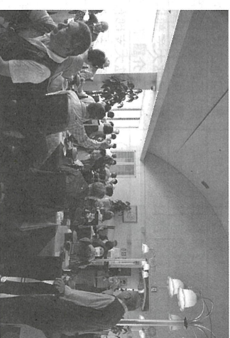
バスツアーで東讃の森代表が挨拶と乾杯

6月23日(金)、高知園日帰りバスツアーに会員・家族46名が参加し、4年振り大盛況のツアーとなりました。 庭と牧野植物園日帰りバスツアーに会員・家族46名が参加し、4年振り大盛況のツアーとなりました。 親しみをもたらしていたこともあって、応募の早い段階で満席になりキャンセル待ちが出ました。 ただ、今年は5月頃から夏日が続く暑さに体力的に