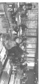
西讃地区総会の模様