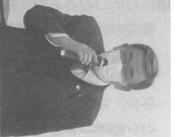
竹本候補と中西候補