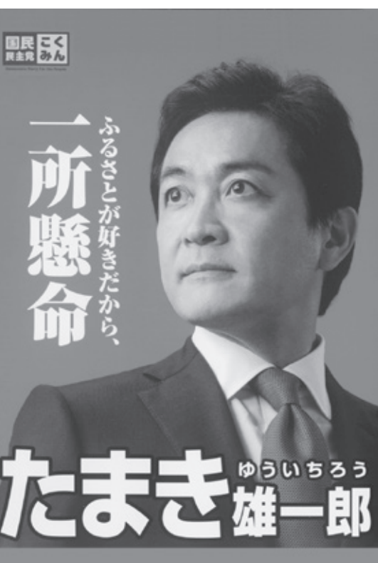
ふるまことが好きだから、