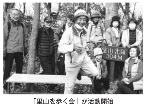
「里山を歩く会」が活動開始

総会への意見・要望を 10月20日までに郵送してください 長引くコロナ禍のなかで、NTT労組退職者の会香川県支部協議会は、今年も規模を縮小し、総会を開催することにしています。総会に参加できない会員の皆さんからも、意見や要望をお聞かせし、総会のなか