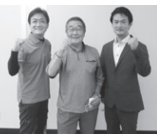
情報労連総会のスリーショット

してきた支持者カードの提出を徹底することが求められています。また、期日前投票を活用するなど、棄権することなく投票することにあります。