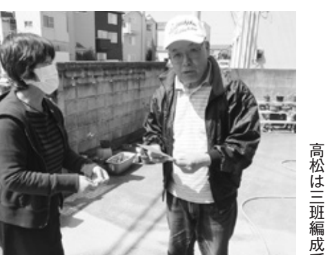
高松は三瓶編成で「お元氣ですか訪問」