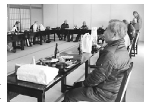
東讃地区協総会の模様

11月28日 東讃地区協 大川オアシス 14名 (新会員含む) 12月4日 小豆地区協 役員会 「島活」4名 12月9日 高松地区協 マリンパレスさぬき 22名(新会員含む) 新型コロナウイルス感染症対策を徹底し短時間で開催されました。