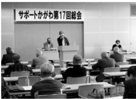
密を避けてのサポートかがわ総会