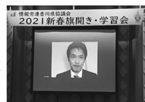
Webでの情報労連旗開き