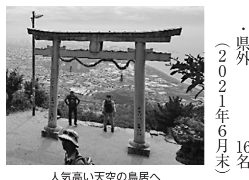
人気高い天空の鳥居へ