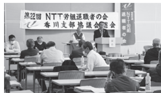
異例となった昨年の支部協総会

今年度も新型コロナウイルス感染症の拡大が続く中、支部協、地区協における会員同士の交流・親睦会の開催は中止せざるをえませんでした。今後の交流と親睦会は新型コロナウイルス感染症の動向を見て対応することとします。