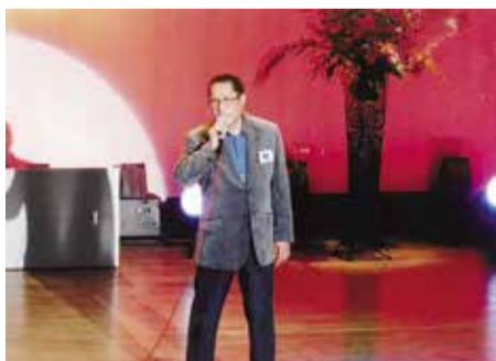
カラオケ発表会のステージで熱唱

カラオケが普及しだすと早速機械を購入、練習に明け暮れます。各種のど自慢大会にも参加するようになり、39歳のとき西日本放送30周年「あの町この町カラオケのど自慢」坂出の部で優勝し、40歳のとき国分寺で行われた