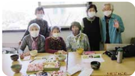
今年はお菓子でお花見句会