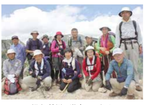
坂出・綾川三遊会メンバーと