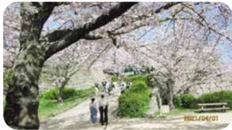
桜吹雪の城山・見返り坂(丸亀)