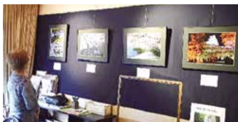
▲アートプラザでの展示風景(同)

フォトクラブは去年6月・アートプラザで作品展を実施しました。コロナ禍で実施するかどうか迷いましたが、コロナ対策をしながら会員7~8名で手際よく展示を進め、期間中は80名を超える記帳と多くの励ましの言葉を頂きました。