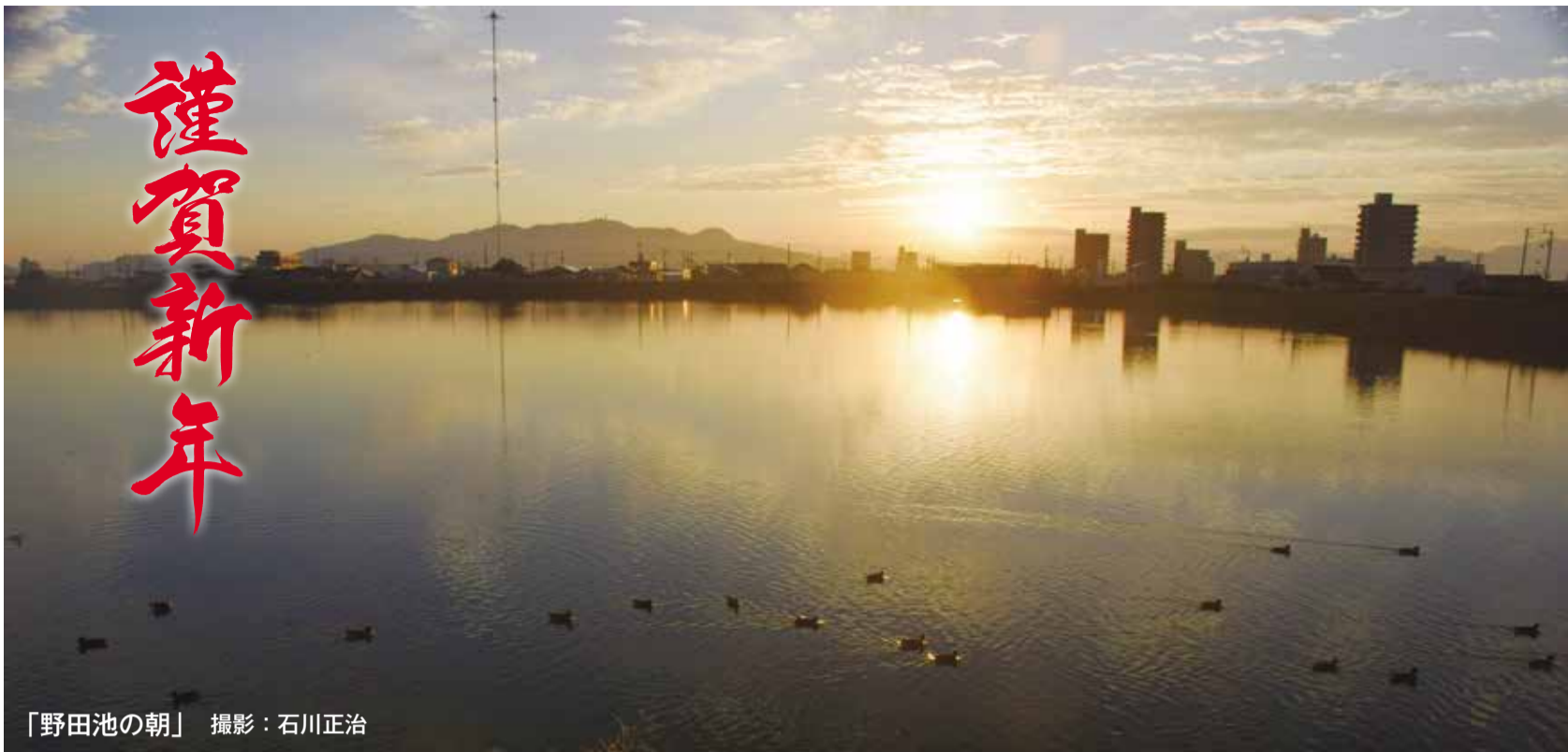
「野田池の朝」