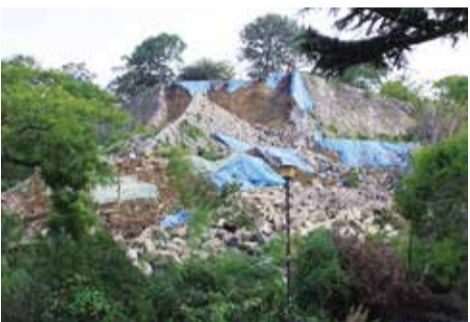
崩落した丸亀城の石垣

丸亀城の石垣が過去に何度も崩れていることはご存じでしょうか。 今回と同じ場所が築城以来7度も崩落しているのです。