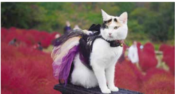
写真「私、アイドルにゃ」 高松市 谷本 信雄

昨年コロナで7月のカラー版は中止となつたが、80歳超アンケートで機関紙の重要性を改めて知りました。今回から「盲便り」を3面に移し、文字数を減らし投稿しやすく紙面を改善。4面は総会での声をうけ、新サークルの発足を周知するなど、親睦拡大にがんばり期待しています。