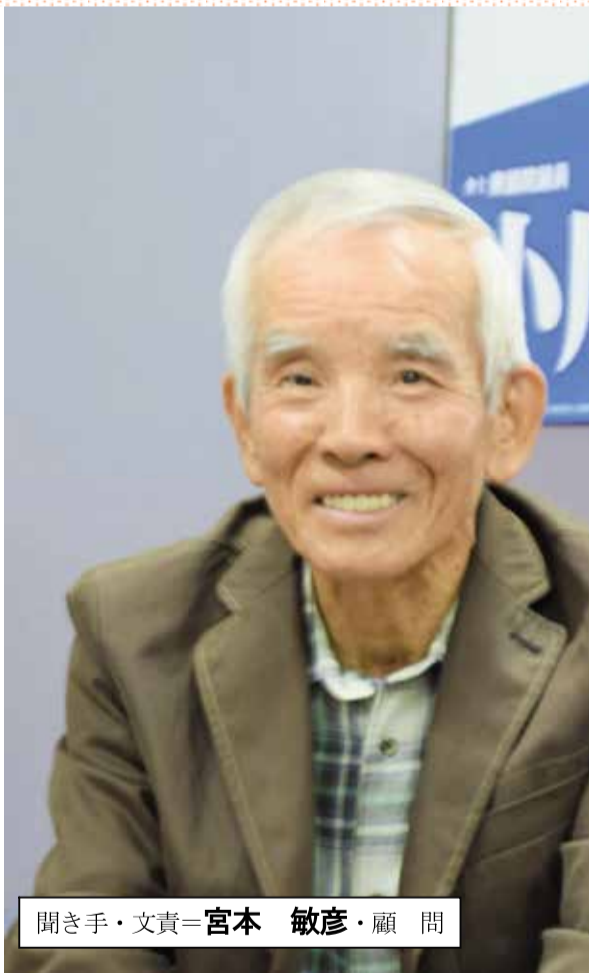
聞き手・文責=宮本 敏彦・顧問