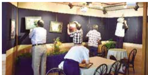
▲アートプラザ展示作業(20年6月)