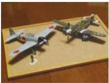
戦闘機のプラモデル