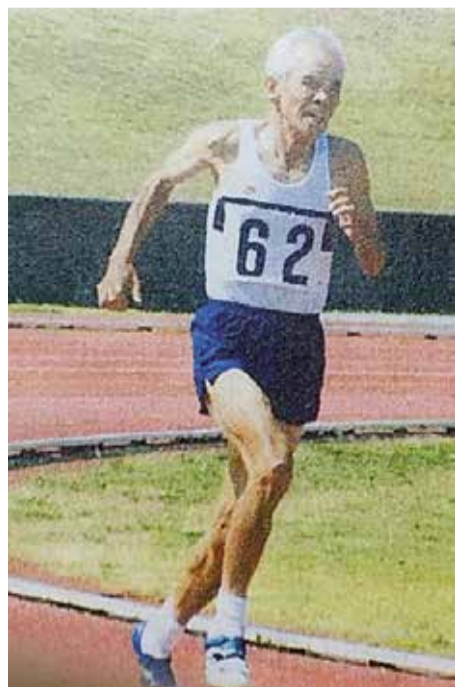
1位でゴール寸前の力走 H21年、マスターズ陸上、1500m 競技 (朝日新聞・H21年9月18日から転載)