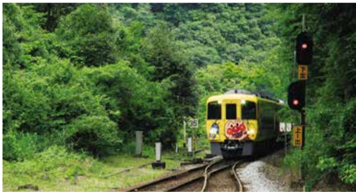
写真「四国の秘境駅」 高松市 吉川 正繼