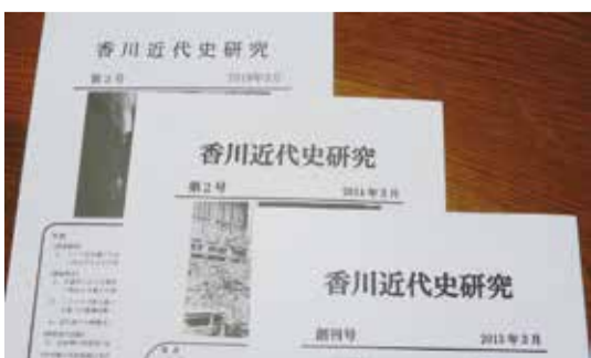
苦勞して編輯した研究史

楽しくて役に立ち、仲間もできる歴史サークル。興味をわきましたら是非声をかけてください。お待ちしております。