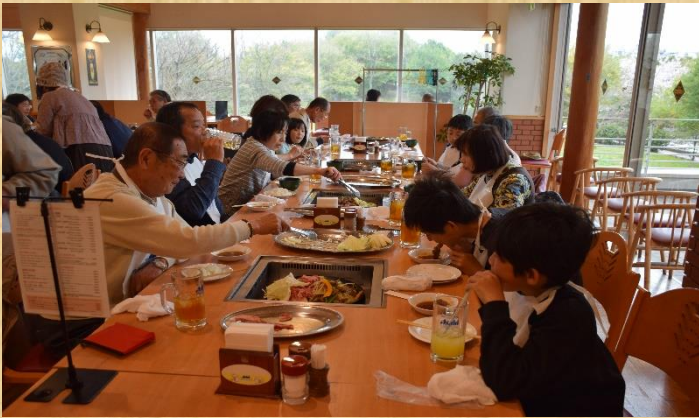
昼食はアサヒビール園で焼肉食べ放題を満喫