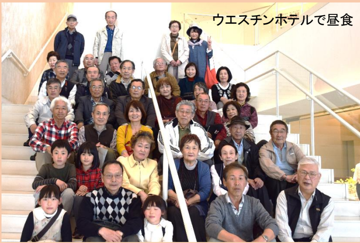
ウエスチンホテルで昼食