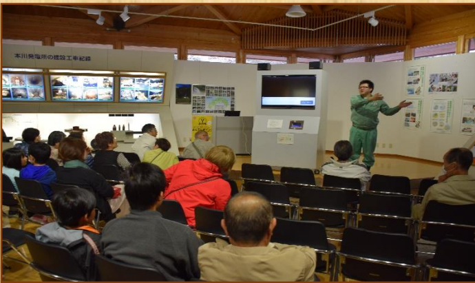
見学前に発電所の仕組みについて説明うける

三地区合同の春レクは4月5日(木)・家族含め25名が参加、高知県の本川水力発電所を見学、現地は桜が丁度満開で二度目の花見となりました。