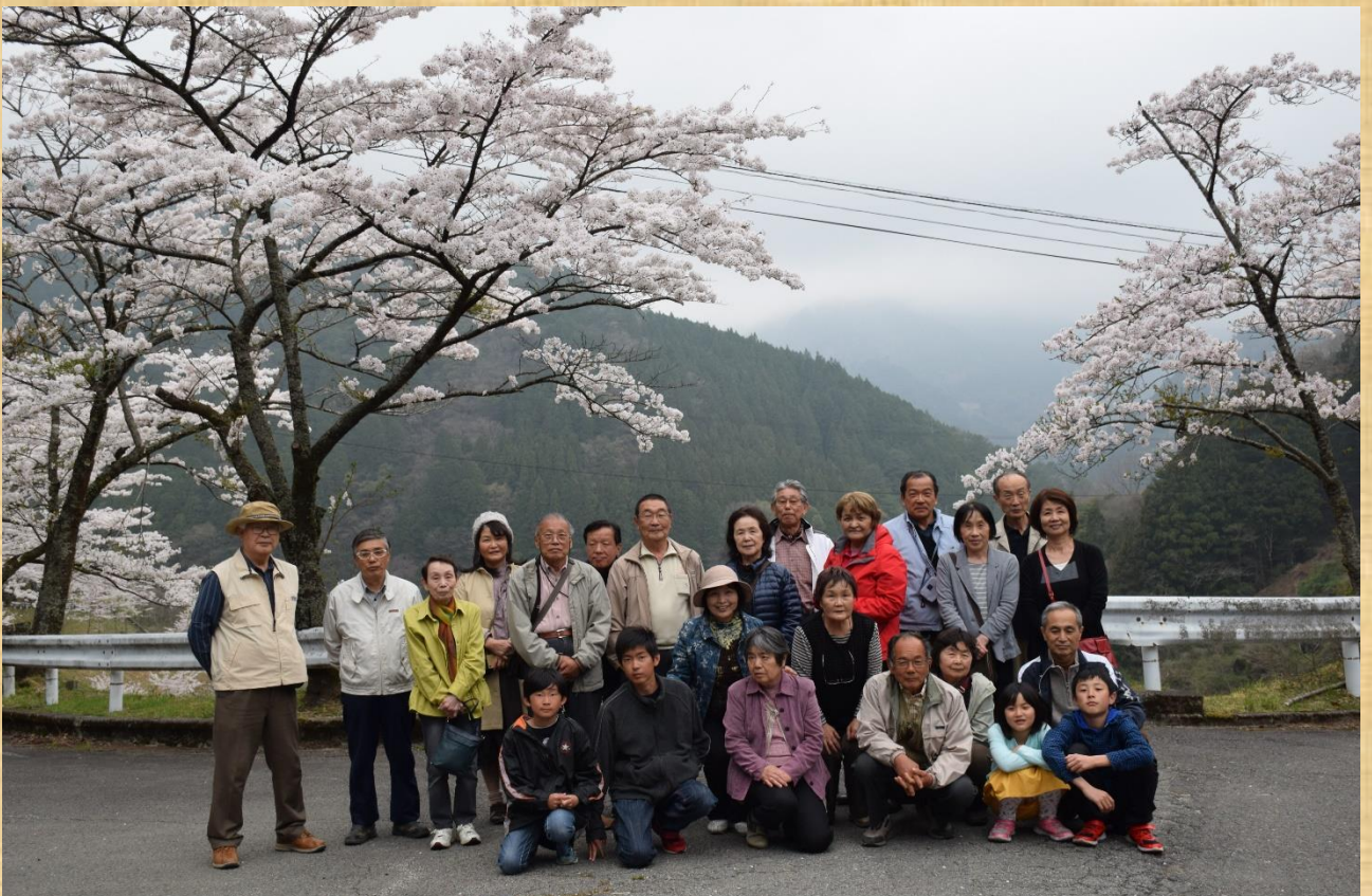
発電所前で今年二度目の桜を楽しみながら記念撮影